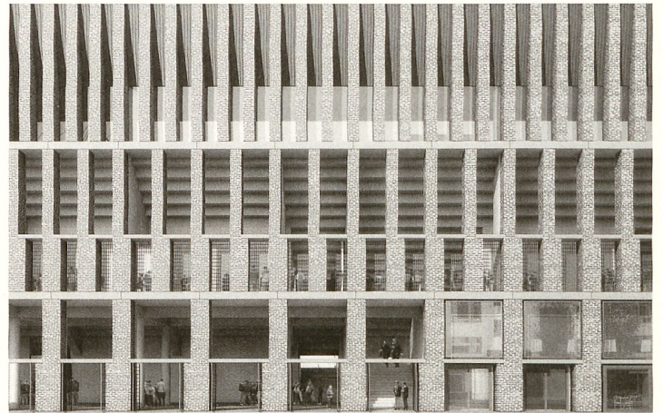
Fassade des Stadionprojektes «Hypodrom». Bild: Burkard Meyer Architekten

50,6 Prozent Nein – ein ebenso enttäuschendes wie lustloses Abstimmungsresultat steht, wie es aussieht, für lange Zeit am Ende der Zürcher Stadionpläne. Die Ablehnung überraschte, da es im Vorfeld nur wenig Opposition gegeben hatte. Das Stadion Zürich fiel nicht einer emotionalen Debatte zum Opfer – es wurde aus Lustlosigkeit abgelehnt. Vor zehn Jahren war um das Projekt «Pentagon» von Meili Peter Architekten heftig gestritten worden; am Ende schwangen die Freunde des Stadions mit 63 Prozent Ja-Stimmen obenaus; erst nach jahrelangen juristischen Verfahren kam es zum Übungsabbruch. Mit dem aktuellen Projekt wollte die Stadt Zürich nun alles richtig machen: Keine Mantelnutzungen, separate Fankurven für die beiden Zürcher Fussballclubs, höchste Sicherheitsstandards trotz – von den Fans ge-