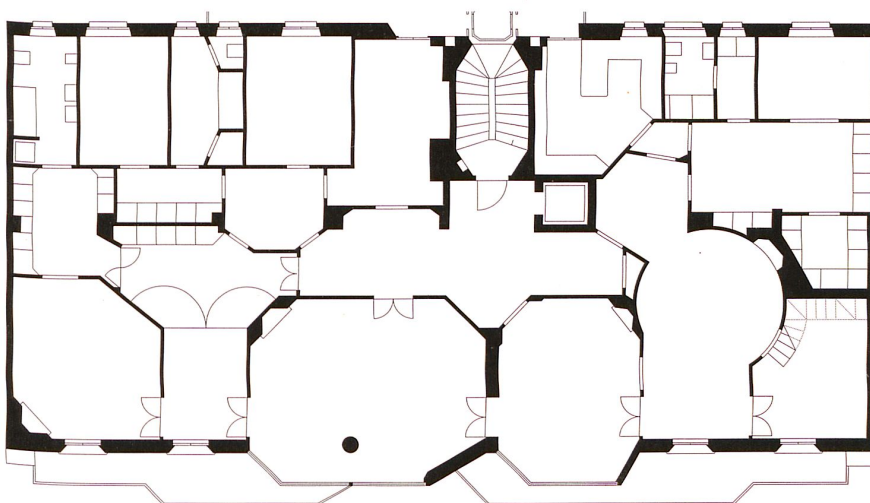
Grundriss der Eigentumswohnung. Plan neu gezeichnet von EMI Architekten