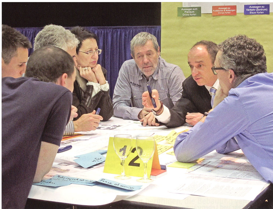
Bürgerinnen und Bürger im Dialog.

Grosses» entstehen könne. Einige Teilnehmende forderten, dass das Thema einer verkehrsfreien Fussgängerzone, einer teilweisen Einbahnstrasse oder zumindest die Einrichtung einer Tempo-30-Zone im mittleren Abschnitt der Landstrasse noch einmal aufgegriffen werde.