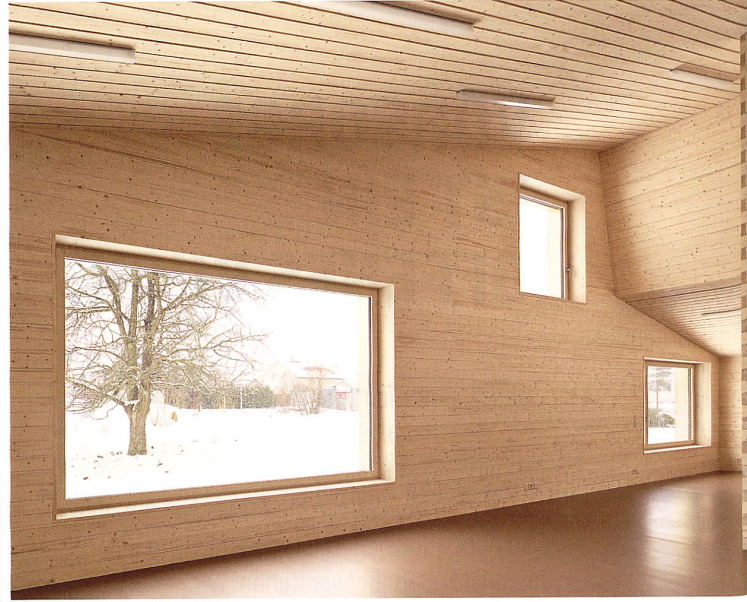
Dachlandschaft als gefaltete Topografie