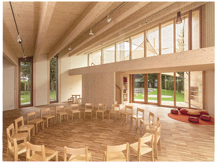
Klassenzimmer mit Galerie im Bereich der höchsten Raumhöhe