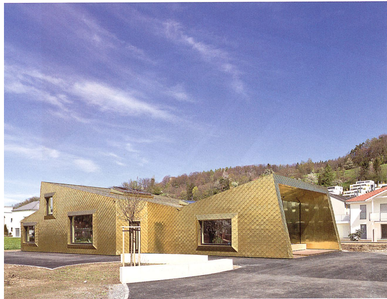
Bewegtes Volumen, eingefasst von Messingschuppen