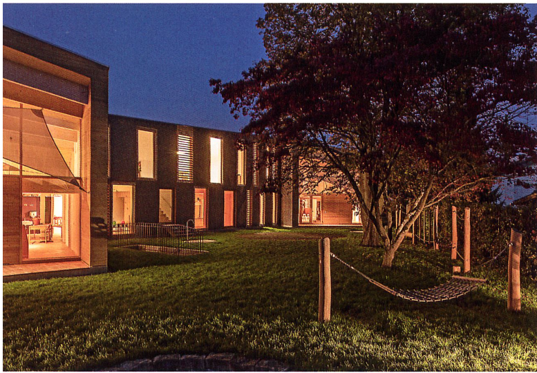
Eingeschossige, aber überhohe Klassenräume fassen den zweigeschossigen Mitteltrakt ein