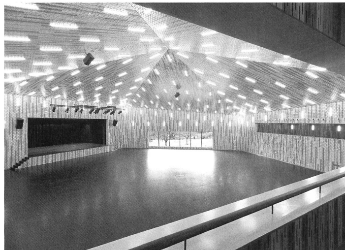
Der festliche Innenraum des Pentoramas in Amriswil.