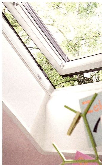
Roto Dach- und Solartechnologie GmbH Bernstrasse 390, CH-8953 Dietikon T +41 44 267 47 47 www.rotodachfenster.ch

RotoComfort i8 ist das erste Klapp-Schwingfenster mit einem elektrischen und automatischen Bedienungssystem, welches im Blendrahmen integriert ist. Per Schalter, Handsender oder auch Smartphone und Tablet bedienbar, bietet das neuartige Dachfenster nach Angaben des Herstellers «Komfort auf Knopfdruck» und freien Ausblick ganz ohne störende sichtbare Antriebselemente. Möglich machen das in die Konstruktion integrierte Spindelantriebe, die das vollständige Öffnen des Flügels nach aussen gewährleisten und somit grösstmögliche Bewegungsfreiheit bieten.