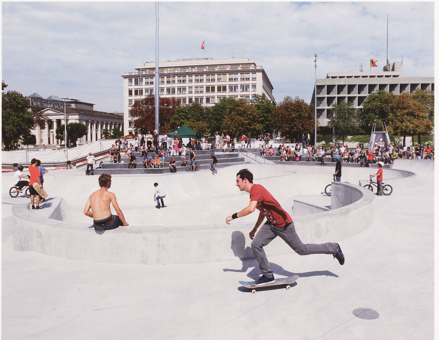
Tagein, tagaus ein Publikumsmagnet: Der Skate-Park von Constructo aus Marseille.