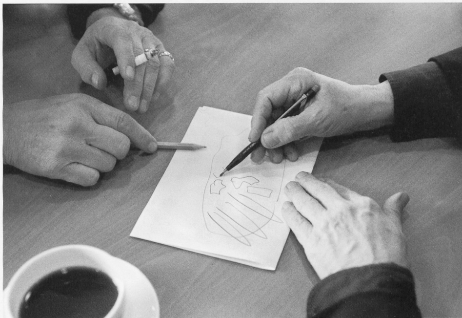
Patchworkfamilientreffen mit Frank Gehry (links), Jean Nouvel und Rem Koolhaas (rechts) anlässlich einer Grundstücksentwicklung in Düsseldorf 1997.