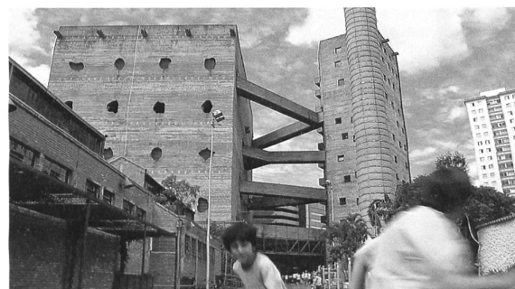
Lina Bo Bardi. Bild: Tapio Snellman

Tchoban Foundation. Museum für Architekturzeichnung