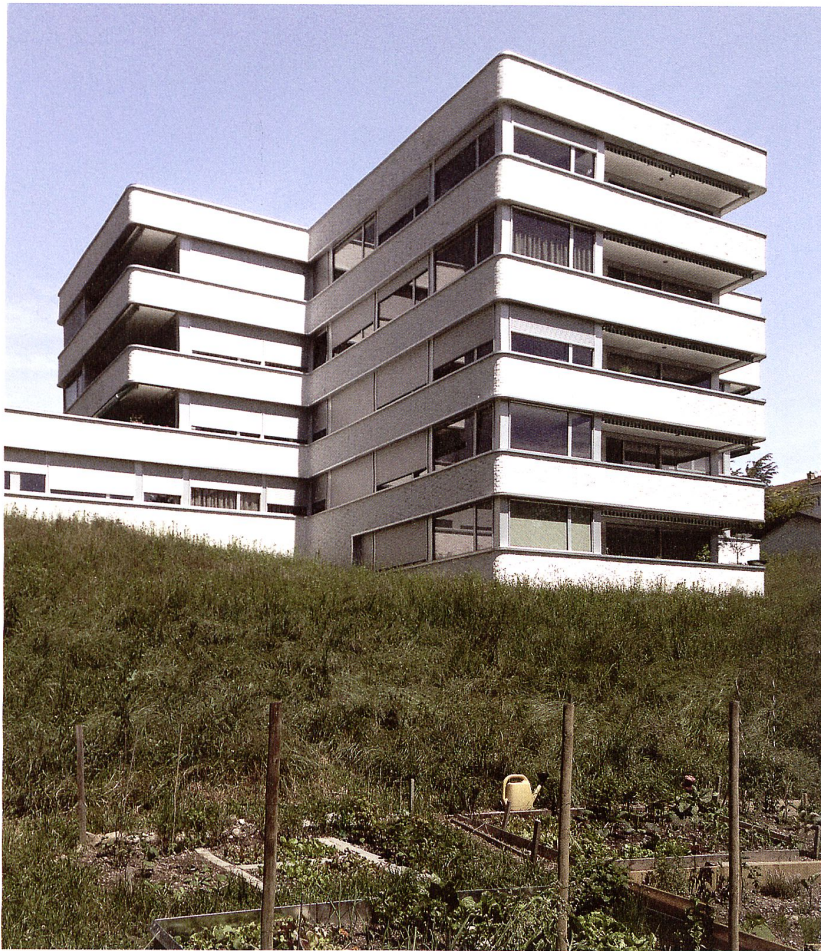
Die fünfgeschossige Südwestseite am Abhang zum Fluss.