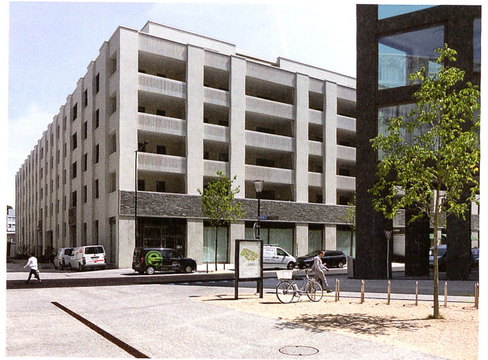
Blick von Süden in Richtung Hauptplatz. Links die Fassade des Hochhauses von Wiel Arets auf Baufeld 7, dahinter dessen Block auf Baufeld 1. Rechts das Büro-Geviert von Max Dudler auf Baufeld 6 (Bild links).