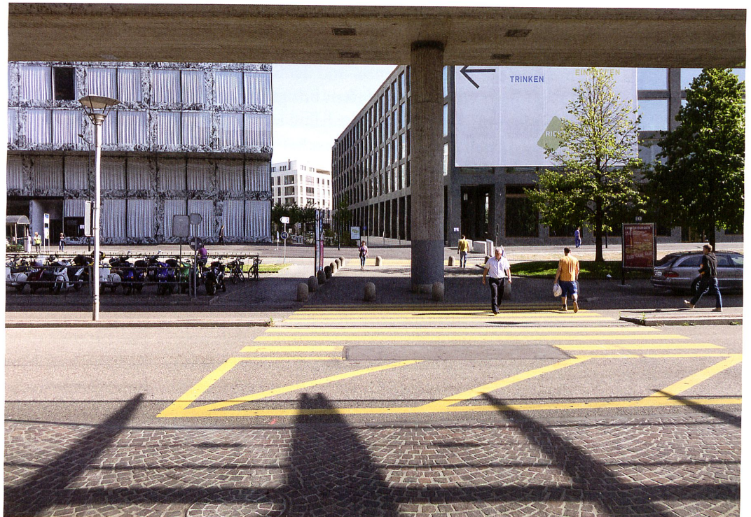
Der Eingang zum Richti-Areal vom Einkaufszentrum Glatt, links das Hochhaus von Wiel Arets und rechts der Bürobau von Max Dudler. Läden und Atmosphäre profitieren von der günstigen Passantenlage zwischen Bahnhof und Mall.