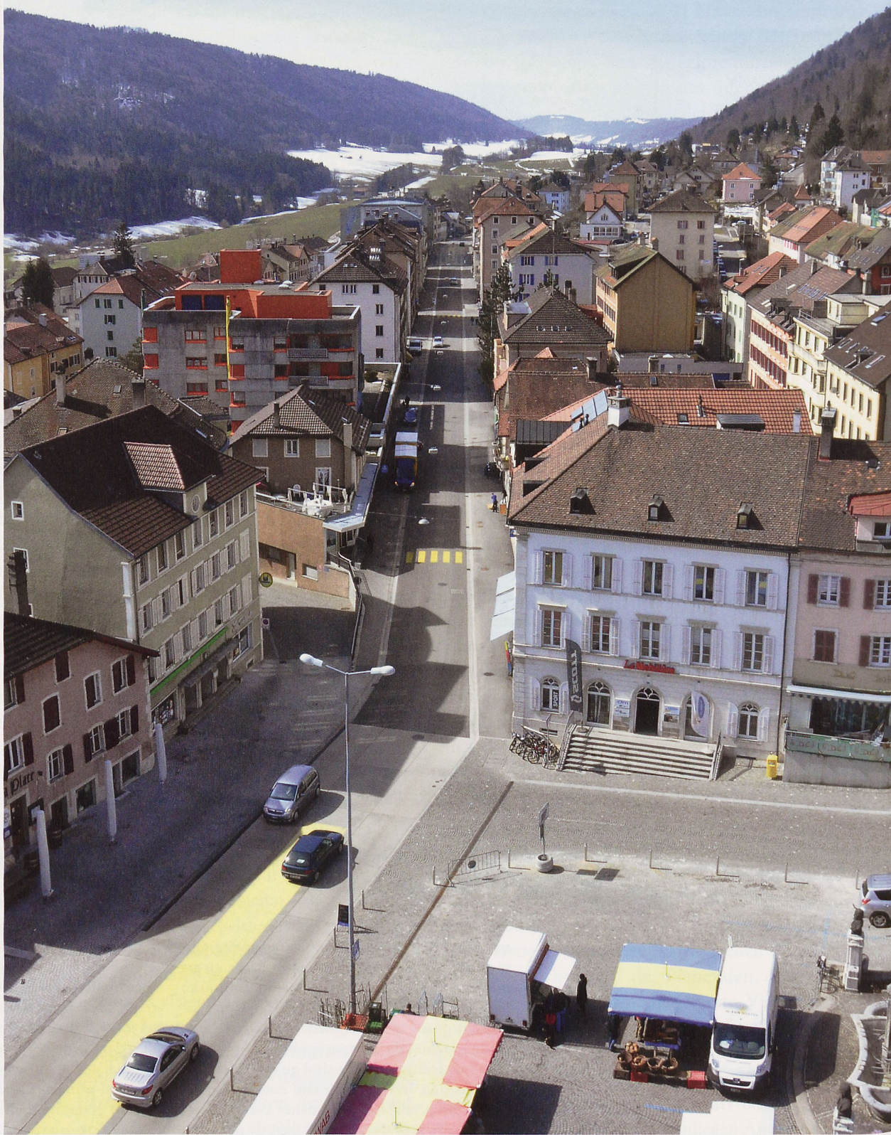
Ortsdurchfahrt St. Imier von RWB Jura