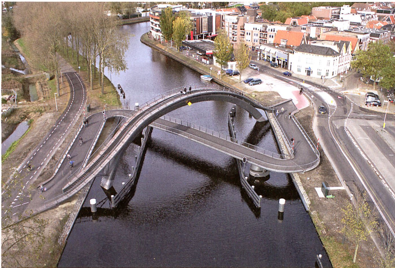
Melkwegbrücke, Purmerend NL

Bauherrschaft Gemeinde Purmerend Architektur NEXT architects, Amsterdam Landschaftsarchitektur Rietveld Landscape, Amsterdam Ingenieure Ingenieurs Bureau Amsterdam (IBA) Dimensionen Spannweite: 66 m Baukosten EUR 6 Mio. (netto) Ausführung 2011–12