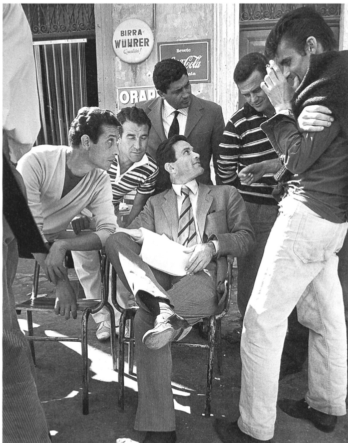
Pier Paolo Pasolini auf dem Set von Accattone, 1961