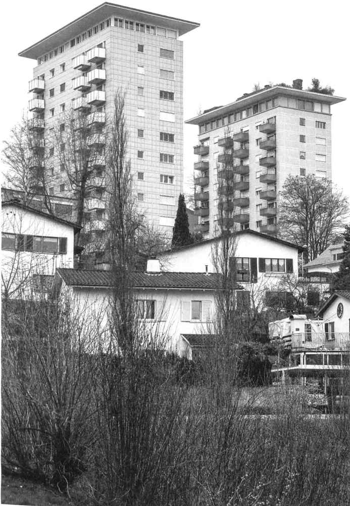
Fünfer- und Weggli-wohnen in Spreitenbach: Einfamilien- wie Hochhäuser profitieren von günstiger Verkehrslage und Nähe zum Grün.