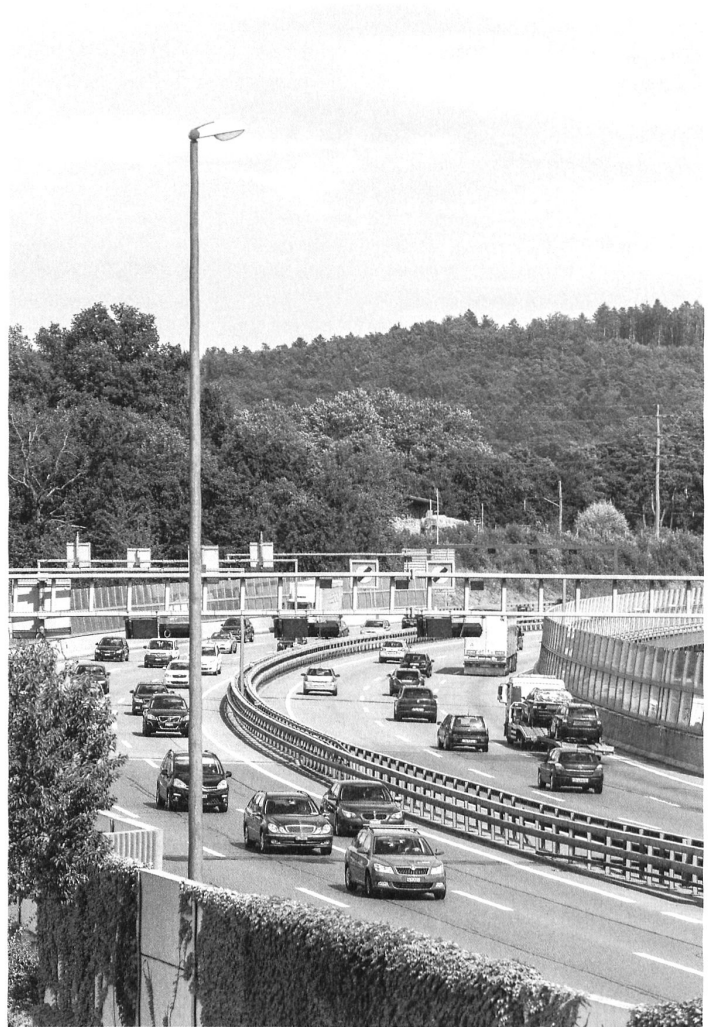
Wo viel Verkehr ist, ist auch viel Agglomeration