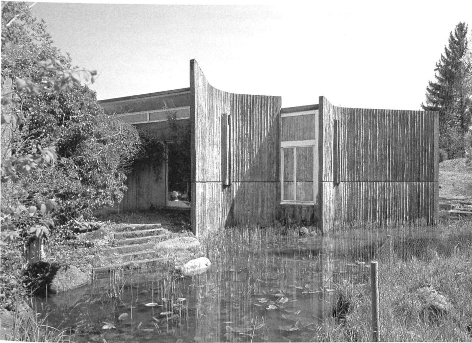
Das 1969 erbaute EFH Neuenschwander «in Binzen» ist Teil der Künstlersiedlung Gockhausen, die in langjähriger Entwicklung entstanden ist. Die enge Verbindung von Wohnbereich und Natur und der skulpturale Ansatz seiner Architektur kommen in diesem Haus zum Tragen.