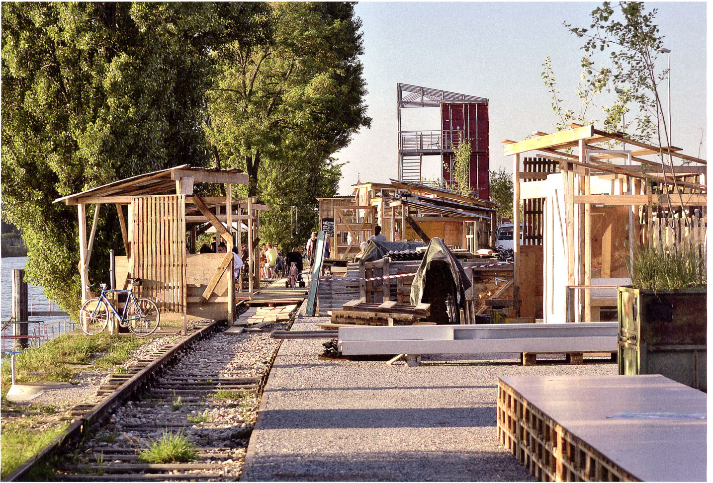
Improvisation, Kreativität und ein Hauch Anarchie: Das Barackendorf des Vereins «Landestelle» wurde aus den Baumaterialien des «Favela-Cafés» des japanischen Künstlers Tadashi Kawamata neu zusammengezimmert.