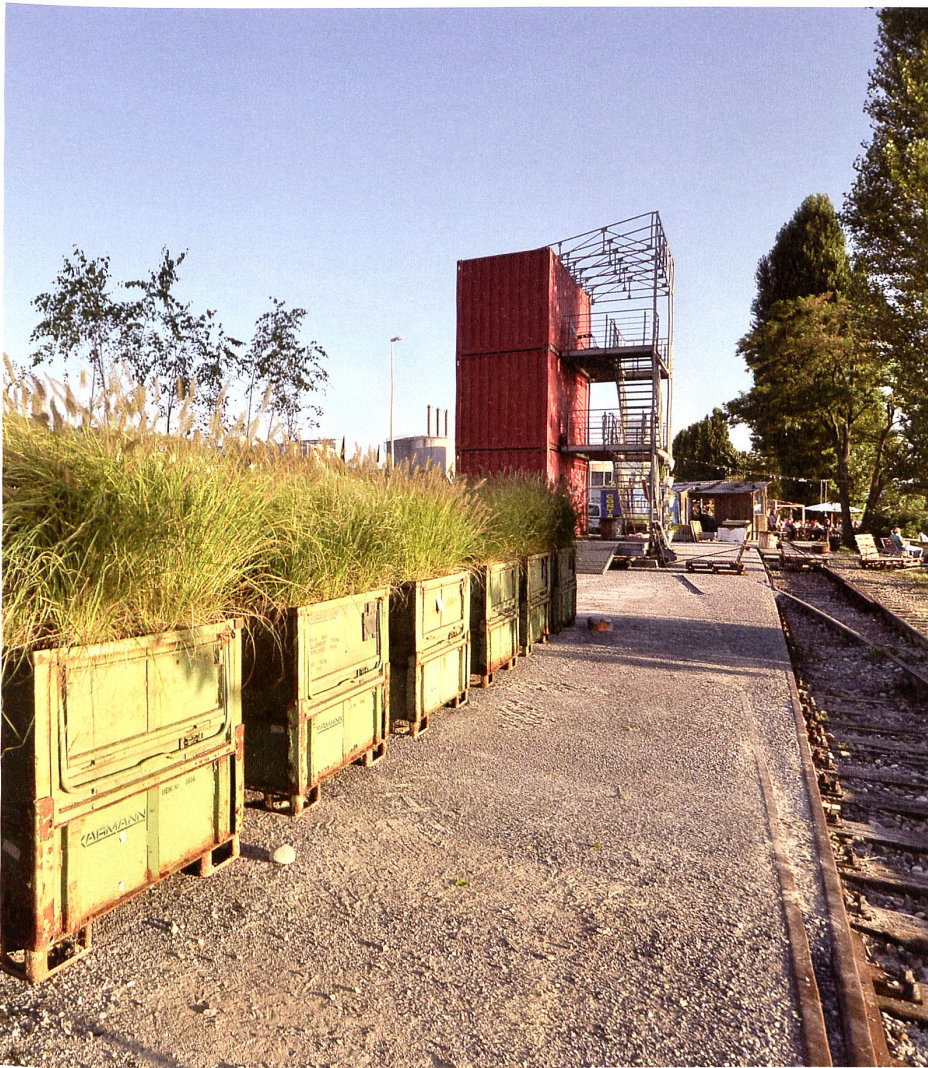
Mobile Begrünung: In den Stahlcontainern wachsen Pionierpflanzen heran; bei Bedarf können die Behälter einfach verschoben werden.

len Streifen Industrieland zwischen ein paar Geleisen, den das Basler Landschaftsarchitekturbüro von Massimo Fontana mit sparsamen Mitteln gestaltet hat, und doch steckt in dieser an sich anmassenden Bezeichnung ein Kern Wahrheit: Man kann durchaus promenieren, sogar am Wasser, und wer Augen hat für den herben Charme eines Hafengebietes mit seinen Containerstapeln, Öltanks und Drahtzäunen, dem ist sogar richtig wohl – er braucht zum Flanieren kein Opernhaus in Blickweite, keine Sicht auf die Schneeberge, keinen schmucken See und keine malerische Landschaft. Dafür erstrecken sich ab hier vierhundert Kilometer Oberrheinische Tiefebene bis hinunter nach