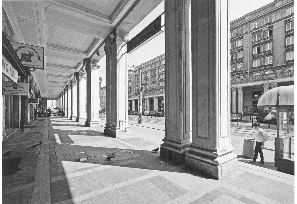
Marszałkowska-Wohnviertel MDM: Südlich des Konstytucji-Platzes (Platz der Verfassung) begleiten Kolonnaden die Marszałkowska-Strasse. Hier blieb die Strassenbreite der Vorkriegszeit erhalten.