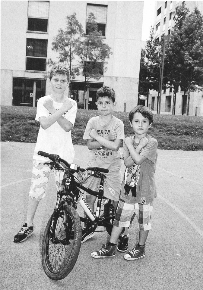
Boyz in the hood: Kinder in der Siedlung Werdwies in Zürich-Altstetten.