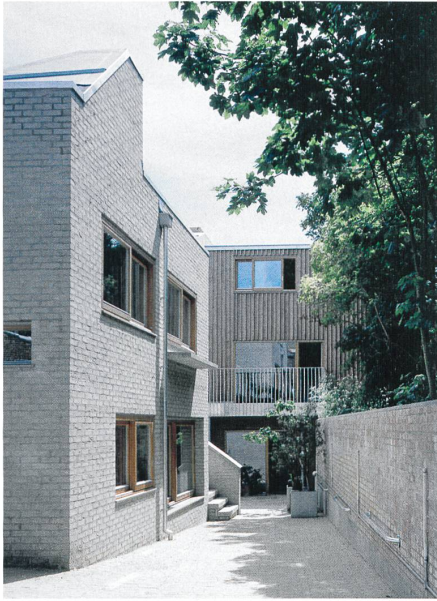
Backstein, Holz und dichtes Zusammenleben: Wohnprojekt Copper Lane, London von HHbR architects → S. 78