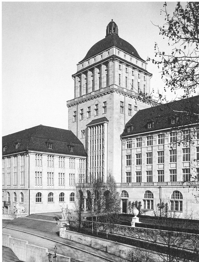
Eingang und Turm der Universität, historische Aufnahme.