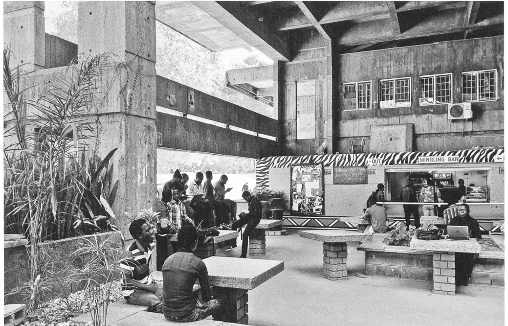
Bauen mit dem Klima: Innen und Aussen verschmelzen zu einem Raumkontinuum in der Universität von Sambia in Lusaka (1965–70) von Julian Elliott und Anthony Chitty.

Ausstellung Architektur der Unabhängigkeit – Afrikanische Moderne bis 31. Mai 2015 Vitro Design Museum Charles-Eames-Str. 2 D-79576 Weil am Rhein Öffnungszeiten: Täglich 10 – 18 Uhr