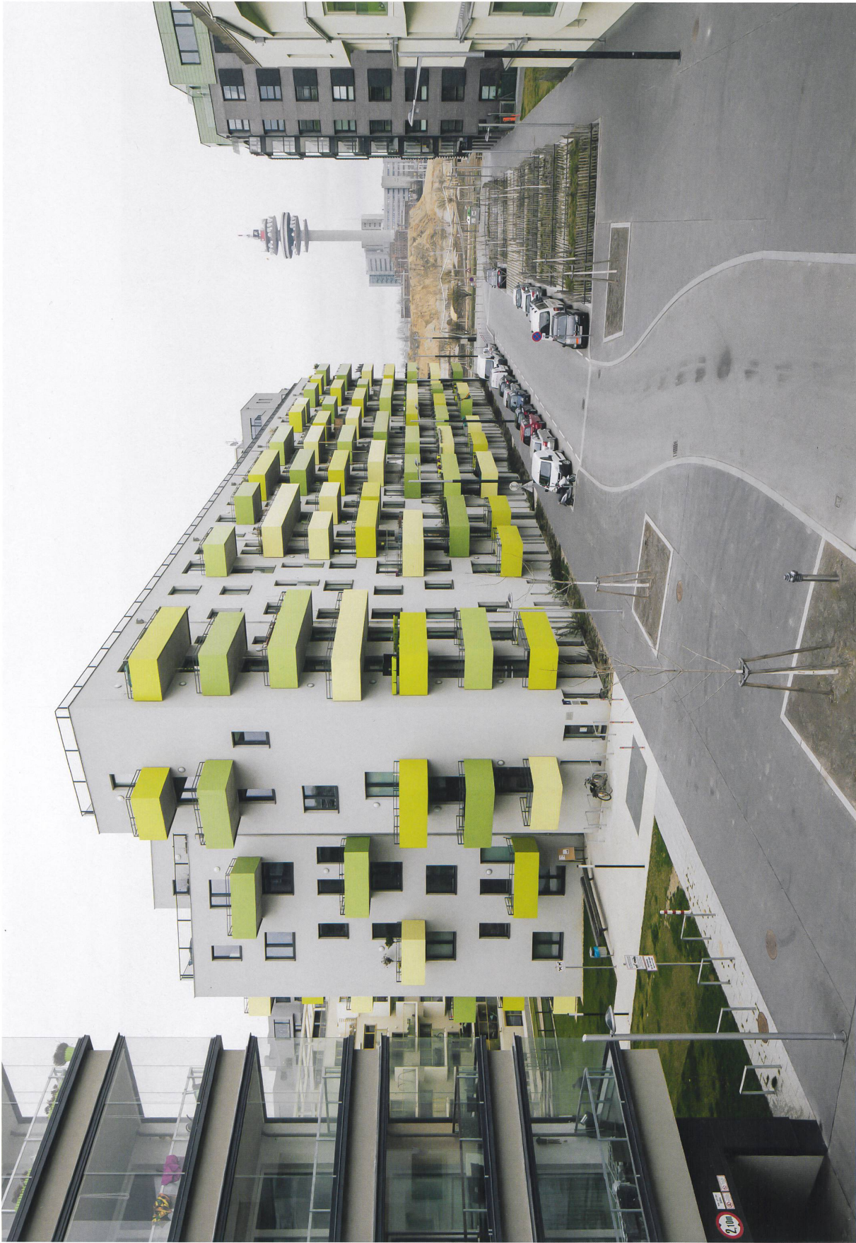
Links: Bauplatz C2.3, mittig C2.4, rechts C3.1

Die Hackergasse fokussiert die Blicke auf den Wiener Funkturm jenseits der Bahngleise. Die Anwohner ziehen keinen Profit vom breiten Profil der Strasse, im Stadtraum hat das Auto die Vorherrschaft.