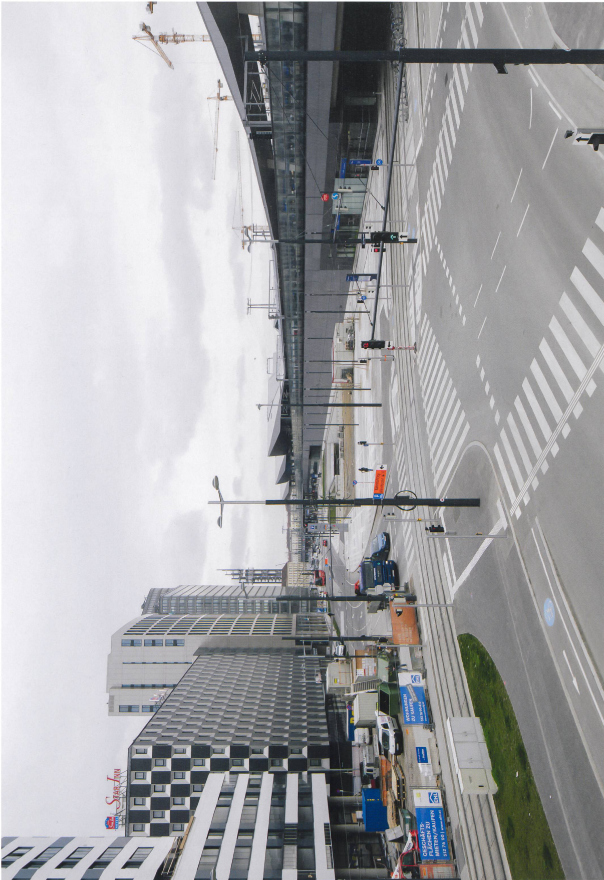
Kaum städtisches Flair zum Auftakt am Wiener Hauptbahnhof: Ein verschlossener Bahnviadukt, eine kolossale Tiefgaragenabfahrt und eine raumgreifende Tramwendschleife dominieren den Stadtraum.