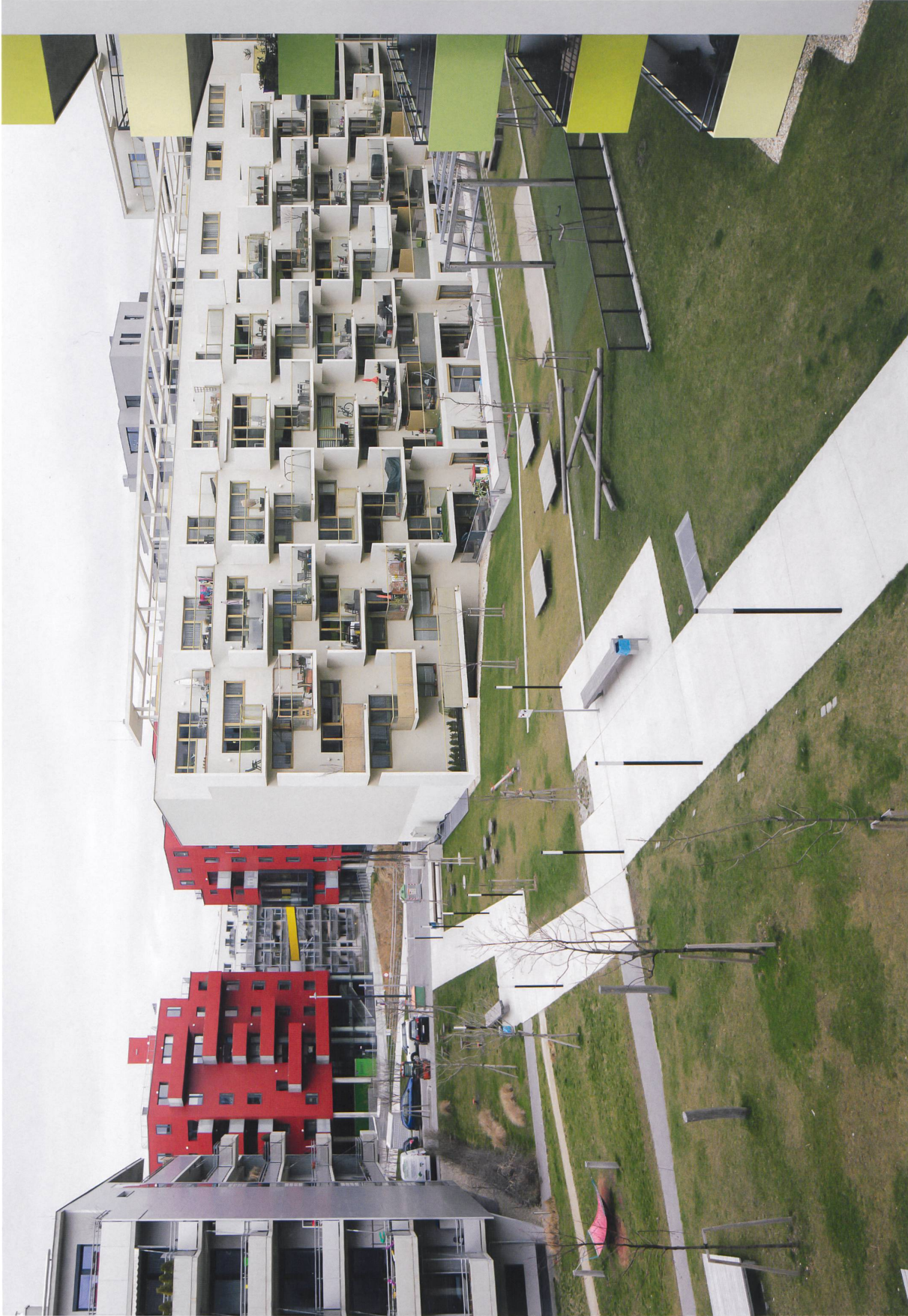
Bauplatz links: C2.2, rechts C2.1, hinten: C1

Die Hofdurchwegung des Blocks C2 verbindet die angrenzenden Baufelder. Doch zu drei Seiten säumen Brandwände den Hofzugang, und die Hofgestaltung lässt Grosszügigkeit und Absprache vermissen.