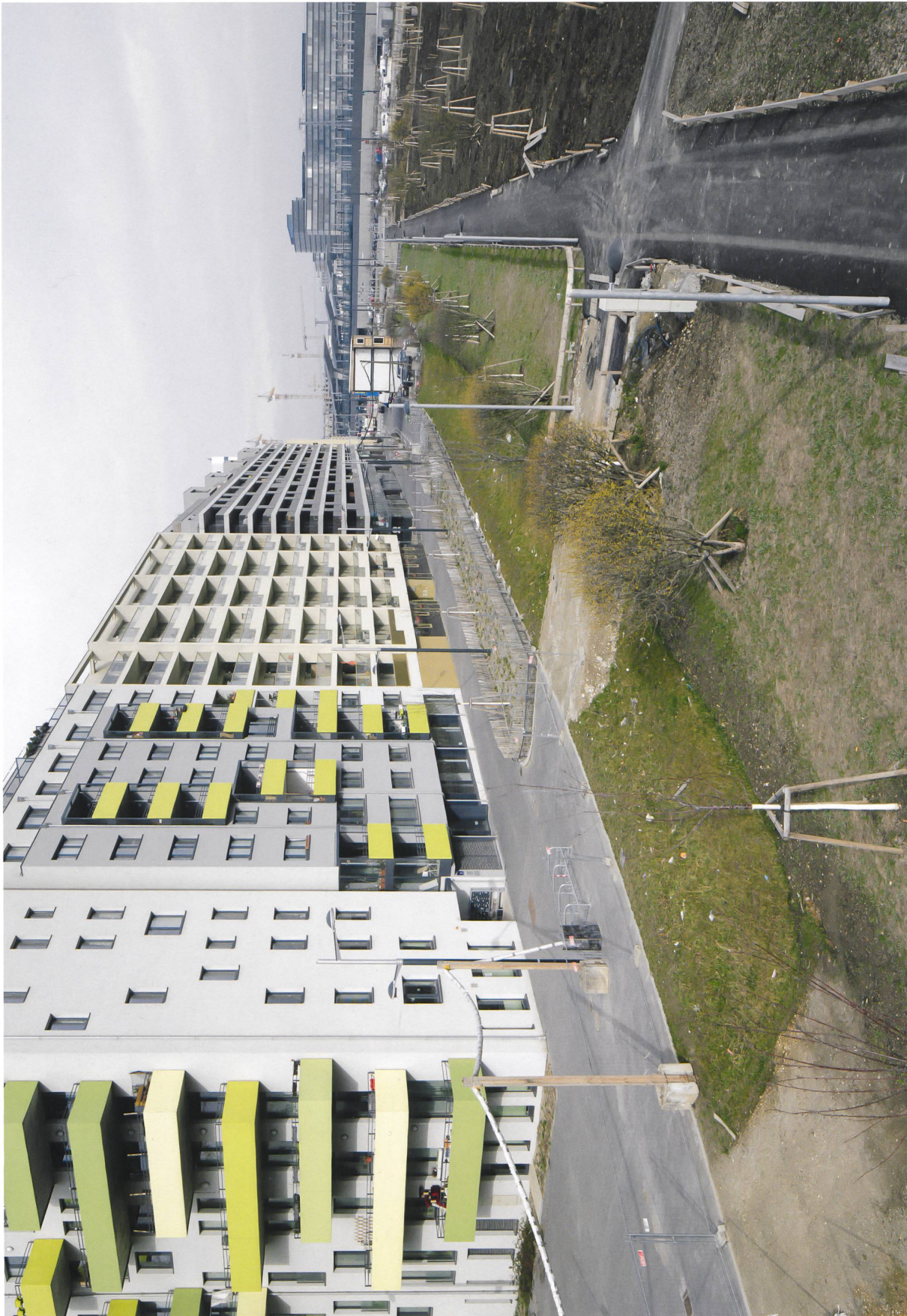
Links: Bauplatz C2.4, anschließend C2.2 und C1

Die Erdgeschosse am Helmut-Zilk-Park verströmen nicht die Euphorie einer Park-Avenue: Zudem verläuft zukünftig die Strassenbahn direkt an dieser Parkkante entlang.