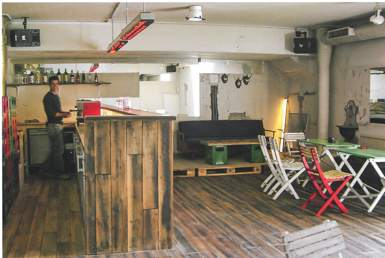
Die Einrichtung der Bar des Theaters brut verändert sich nach den aktuellen Bedürfnissen.

tinuierliche Baustelle umgewandelt, um den Prozess der Raumproduktion offen zu legen, und für die Wiener Festwochen hat sie eine vielfach nutz- und aneignbare Raumsulptur aus Recyclingmaterialien realisiert.