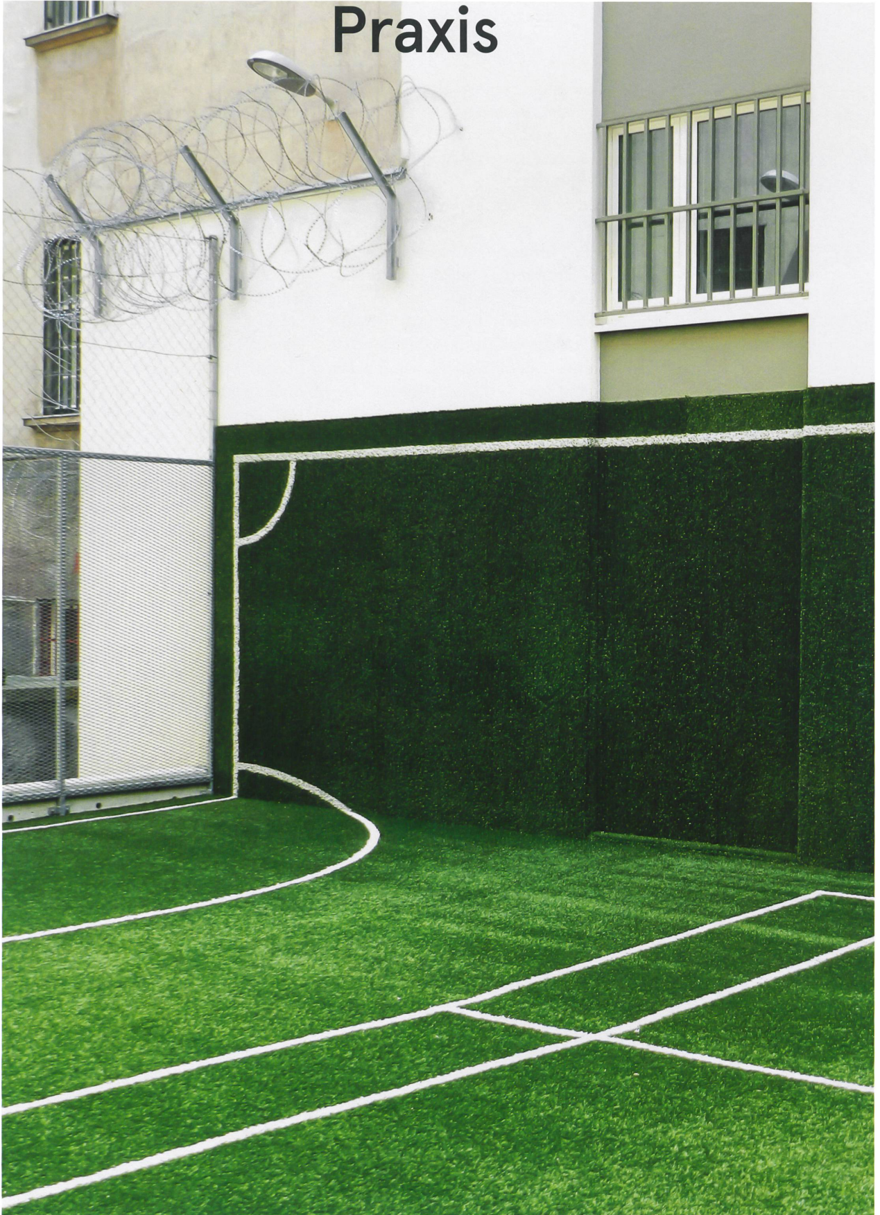
Der Kunstrasen rollt die Wände im Männerspazierhof des Gefängnisses Krems hoch: Kritik mit den Mitteln eines Kunst-am-Bau-Projekts.