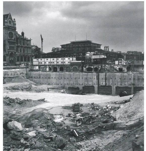
Blick in die riesige Baugrube nach Abbruch der historischen Markthallen – in das sogenannte Trou des Halles , ca. 1973.