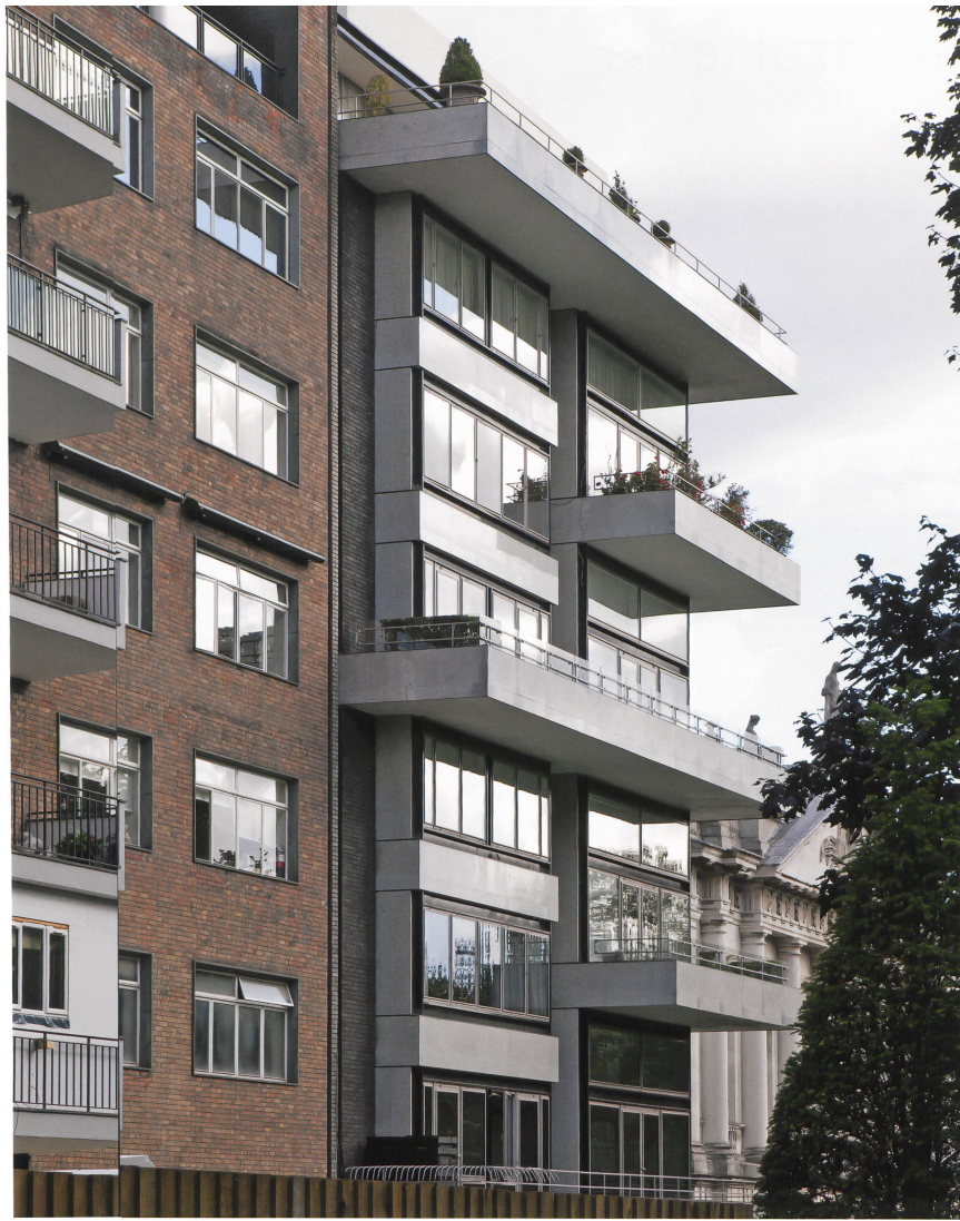
Ganz im Stil seiner Zeit ist die Erdgeschosszone des Appartementhauses leicht und filigran ausgebildet.