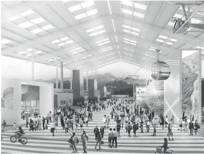
Die Kreuzung: Halle mit Gondelbahn