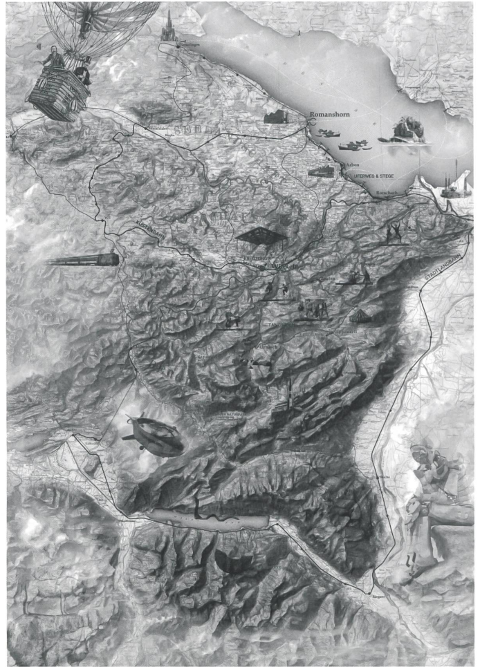
Das siegreiche Konzept Expedition 27 verbindet Landschaften mit bestehenden Bahnringen. Berg , Küste und Kreuzung stehen für typische Lebensräume der Schweiz. Plan: Hosoya Schaefer, Studio Vulkan, Plinio Bachmann

Die Aufgabe war breit, aber klar, denn die Auslober hatten ihre Hausaufgaben gemacht: Eine interkantonale Arbeitsgruppe entwarf einen durchdachten Planungsprozess, Vorgaben für den Wettbewerb und Leitideen. Dabei zog sie gründliche Lehren aus der Expo.02, aus der anfänglich unglücklichen Planung ebenso wie aus der mageren Nachwirkung. Die Leitideen bekräftigten den Wunsch nach «einer fundierten Auseinandersetzung zur Zukunft der Schweiz», gesellschaft-