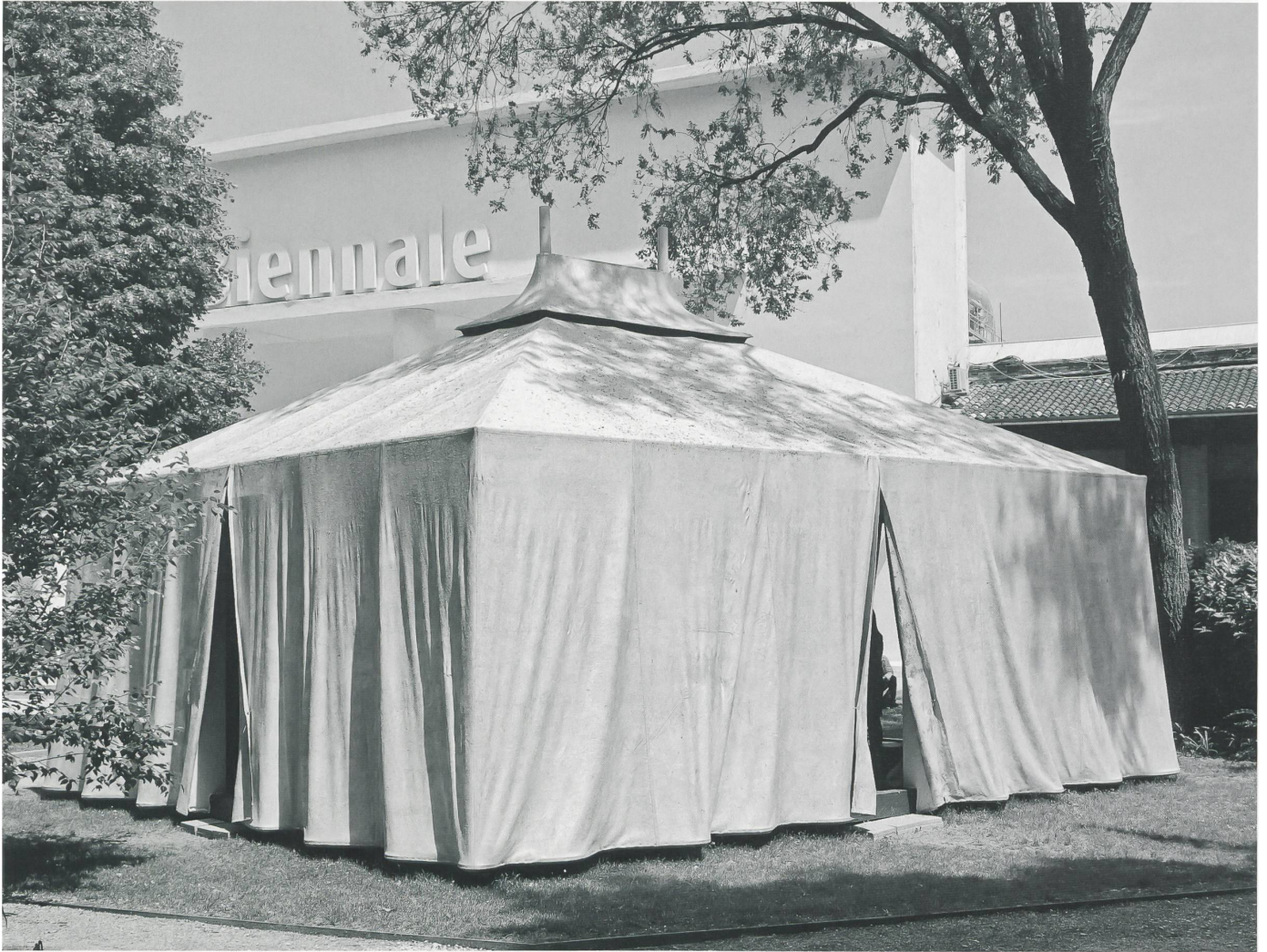
Halb Zelt, halb Aluguss-Skulptur: der Pavillon von Manuel Herz gilt dem Volk der Sahraui, die seit 40 Jahren selbstverwaltet in Lagern an der Grenze der Westsahara leben.

15. Architektur-Biennale Venedig bis 27. November 2016 Arsenale, Giardini sowie diverse Ausstellungen in Venedig Reichhaltiges Begleitprogramm www.labiennale.org Programm des Salon Suisse: www.biennials.ch