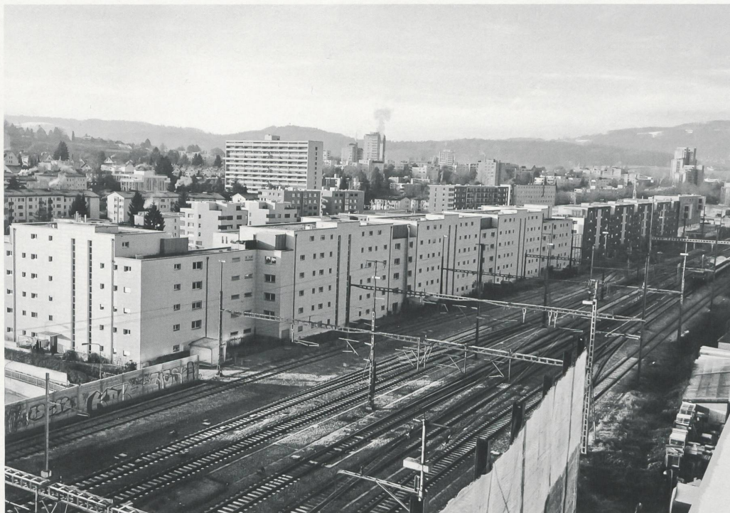
Wenn keine Lüftungsfenster mehr möglich sind, sehen Strassenfassaden bald aus wie an der Bahnlinie in Schlieren.

Dominik Bachmann hat im Heft 1/2 – 2016 darauf aufmerksam gemacht, dass die Praxis zur Einhaltung der Lärm-Immissionsgrenzwerte vor dem Bundesgericht einen schweren Stand haben dürfte. Mittlerweile hat das Gericht gemäss Pressemitteilung am 16. März entschieden (S. 46). 2 Das Urteil wird die Spielräume im Wohnungsbau einschränken.