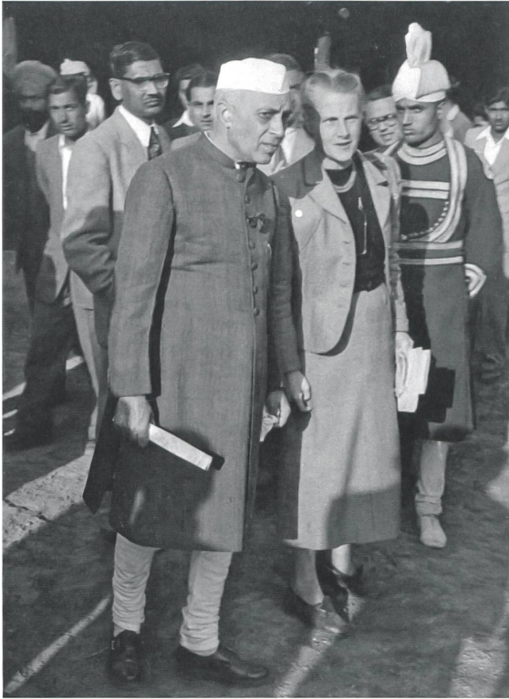
Jacqueline Tyrwhitt, Leiterin einer technischen Hilfsmission der Vereinten Nationen, führt den indischen Premier Nehru durch das Village Centre der Ausstellung zu Low Cost Housing in New Delhi 1954.

Perspektive von der «Berechtigung» zur anerkannten Theoriebildung ausgeschlossen, da sie keinen dominierenden Diskurs verkörpern.