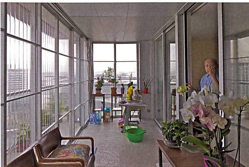
Philippe Ruault, 2012. Umbau Tour Bois le Prêtre, Paris, 2011, Druot, Lacaton & Vassal

Architektur ist aber keine autonome, sondern eine soziale Kunst. Ihr Zweck ist immer auch ein dienender, denn sie operiert in einem gesellschaftlichen Spannungsfeld. 1 Um Architektur aber beurteilen zu können, braucht es den Test ihrer Alltagstauglichkeit. Ein wirksames Kriterium dafür ist der Gebrauch. Der Gebrauch von Architektur ist der Grund, weshalb