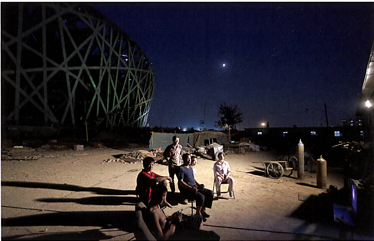
Iwan Baan, 2007. Nationalstadion Beijing, 2008, Herzog & de Meuron