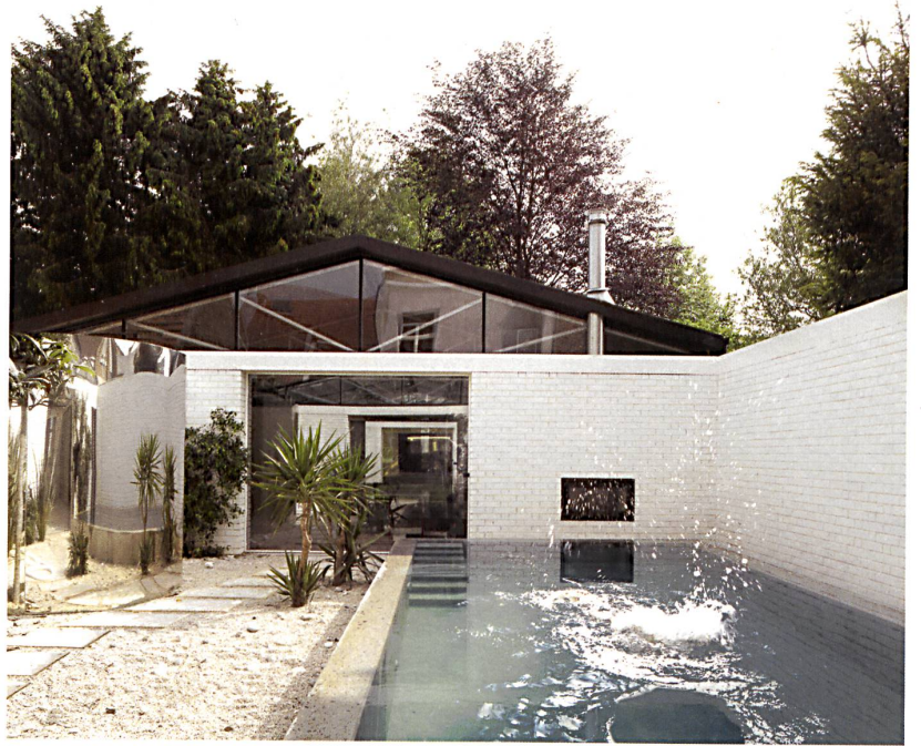
Bas Princen, 2012. Wochenendhaus Merchtem (B), OFFICE Keersten Geers David van Severen