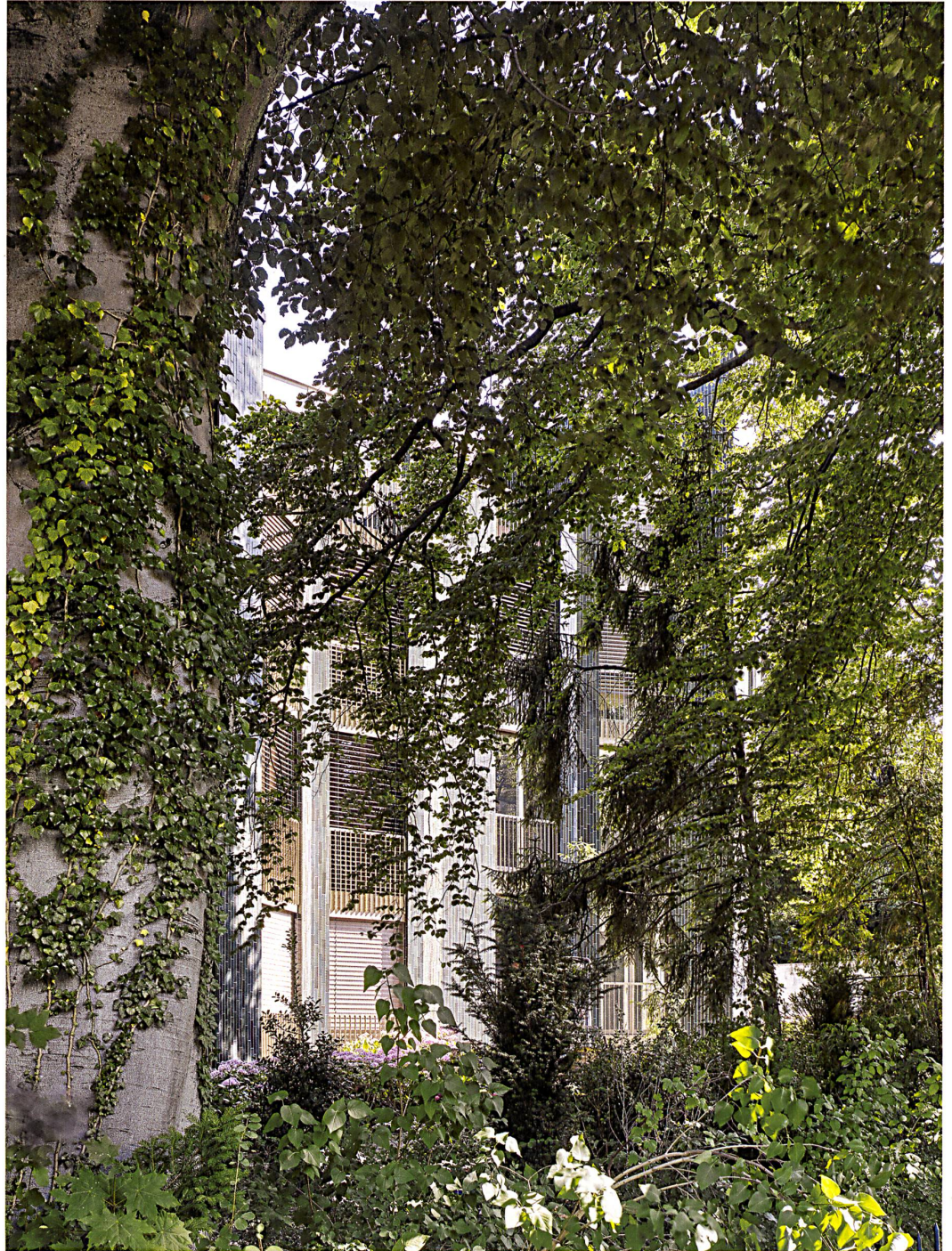
Roland Bernath Mehrfamilienhaus Steinwiesstrasse, Zürich, EMI Architekten wbw 6–2016

Es hat uns einige Diskussionen gekostet, bis wir uns schliesslich entschlossen, mit diesem Bild den Auftakt für die Besprechung des Wohnprojektes zu wagen. Aber wer je in Zürich-Hottingen vor dem Haus stand, vergisst nicht so schnell, wie eng dort Bau und Baum verwachsen sind. Die Entwerfer haben das polygonale Wohnhaus geradezu um den Baum herum entworfen. Die Farbe der grünen Fliesen ist seinem kühlen Schatten entliehen. Die Loggien sind erfüllt von seinem Geruch, nicht nur nach einem Sommergewitter. Der Baum ist der Schlüssel zum Haus, somit auch zu seiner Erzählung. — Roland Züger