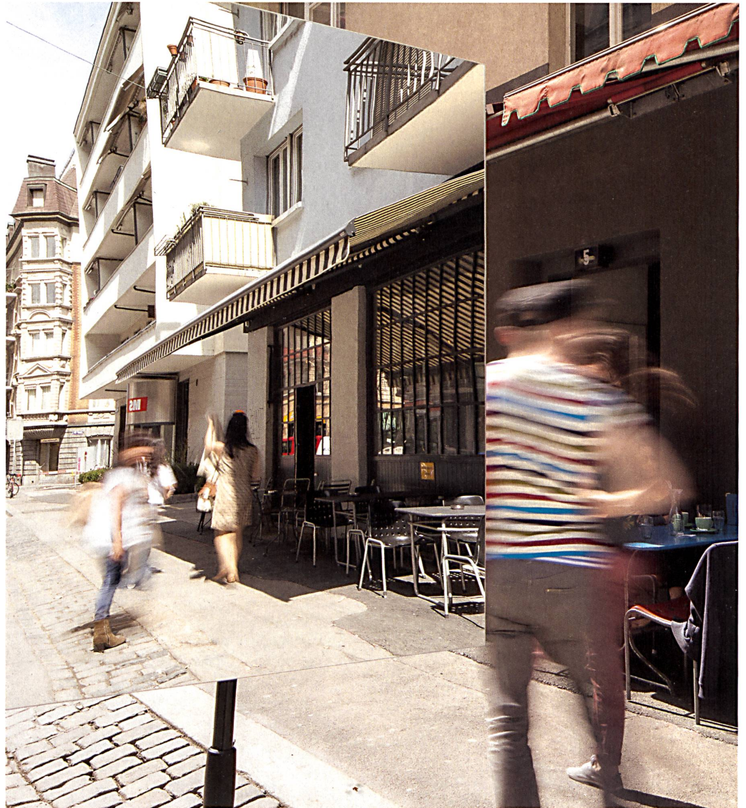
Roman Keller Sockel im Gebrauch im Zürcher Kreis 5 wbw 6–2013