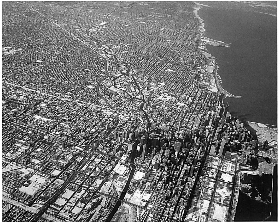
Die Logik des Eisenbahnknotens und nicht der Komposition hat den Hochhauswald in Chicago spriessen lassen.