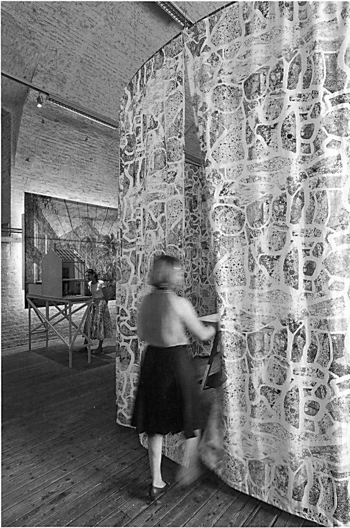
Assemble entwickelte mit Bewohnern auch Objekte, wie Möbel, Vorhänge oder Türgriffe. Sie machen den Reiz der Ausstellung aus.

Das Londoner Barbican Arts Center wurde durch die mediale Berichterstattung auf Assemble aufmerksam und beauftragte das Kollektiv, eine Sommerausstellung zu gestalten. Die daraufhin unter zwei Autobahnbrücken errichtete Raumin szenierung Folly for a Flyover (wbw 5–2015) lockte innerhalb von neun Wochen 40 000 Besucher an. An dem unwirtlichen Ort wurde nun gegessen, an Workshops teilgenommen und Aufführungen beigewohnt.