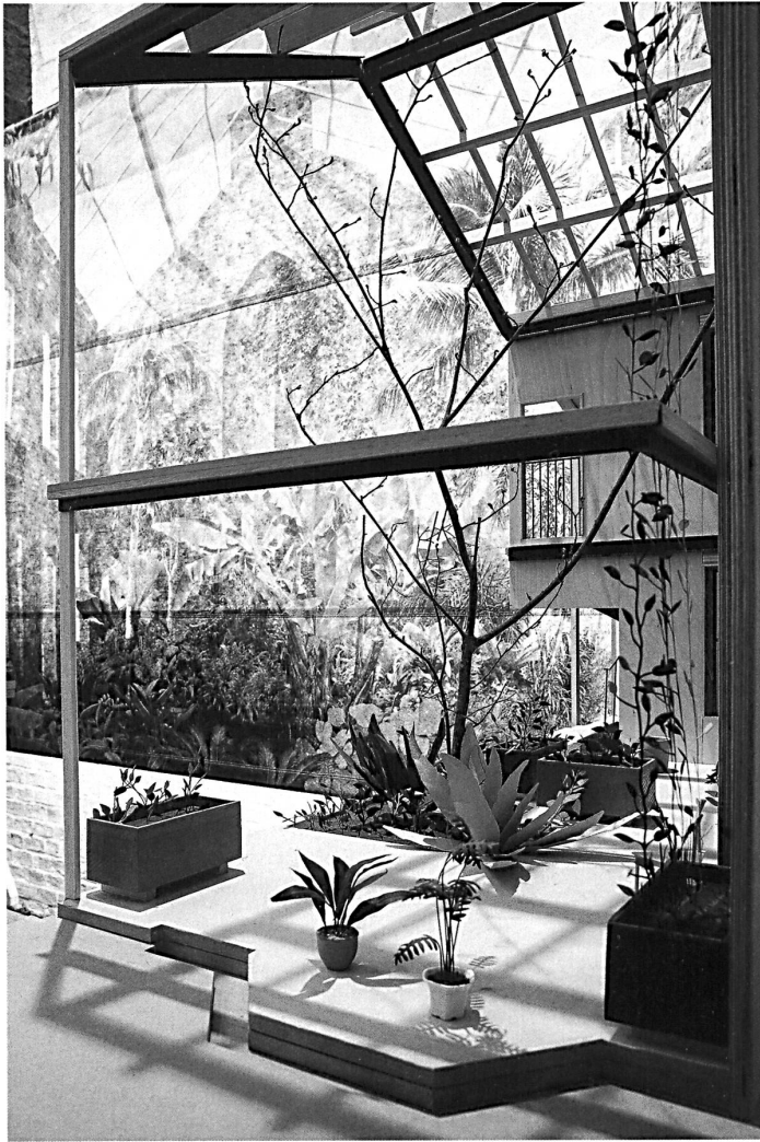
Blick in ein 1:1-Modell in der Ausstellung: Gewächshaus der Granby Street Liverpool.