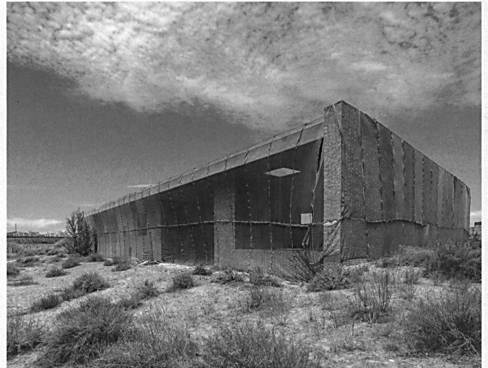
SAM, Basel: EM2N, Zwei Villen, Ordos

Kriens Museum im Bellpark Finding Brutalism bis 5.11. www.bellpark.ch