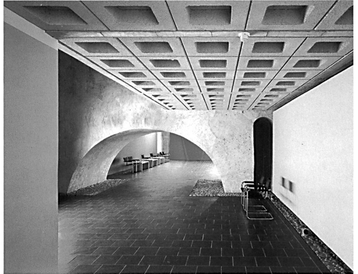
Die Wiederherstellung von sieben Klausen am Kreuzgang der Kartause Ittingen (1981–83) zur Nutzung als Kunstmuseum Thurgau ist eines der bekanntesten Projekte von Antonioli + Huber und strahlt über die Ostschweiz hinaus.