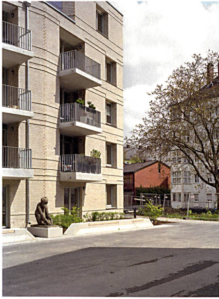
Städtischer Ausdruck: Innenhofbebauung an der Braystrasse von Palais Mai. → S. 26

Titelbild: Debatten in der Boomstadt. München wächst und baut neue Quartiere. Doch wie städtisch sollen diese aussehen? Und wie sozial ist der Wohnungsbau organisiert?