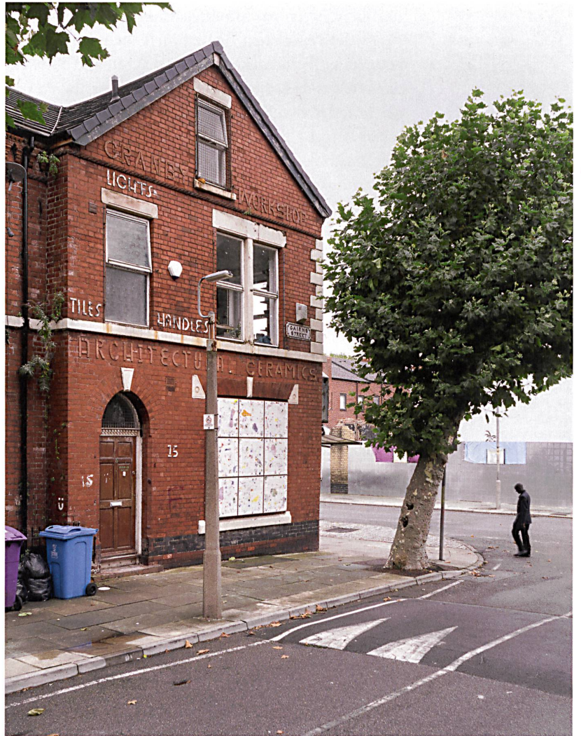
Mit dem Granby Workshop (oben) hat Assemble im Quartier zusammen mit der Bewohnerorganisation auch ein soziales Projekt aufgebaut.