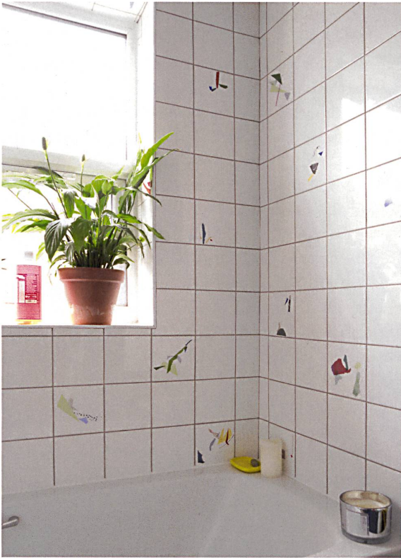
Der Workshop recycelt Baumaterialreste teils zu Produkten, die für die Renovation der Gebäude verwendet werden, etwa Badfliesen (oben) oder Cheminée-Einfassungen (unten).