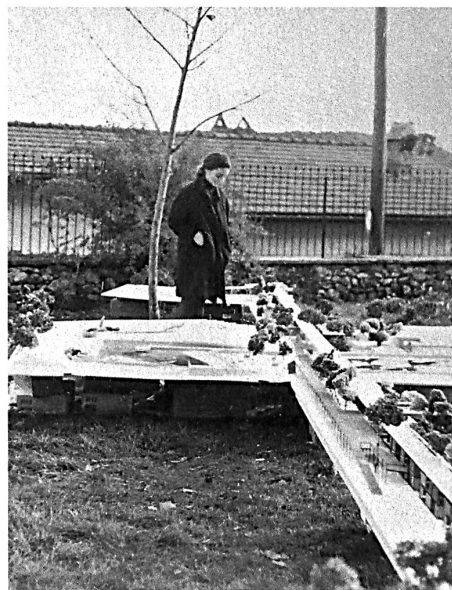
7 Wie Anm. 4, S. 21.