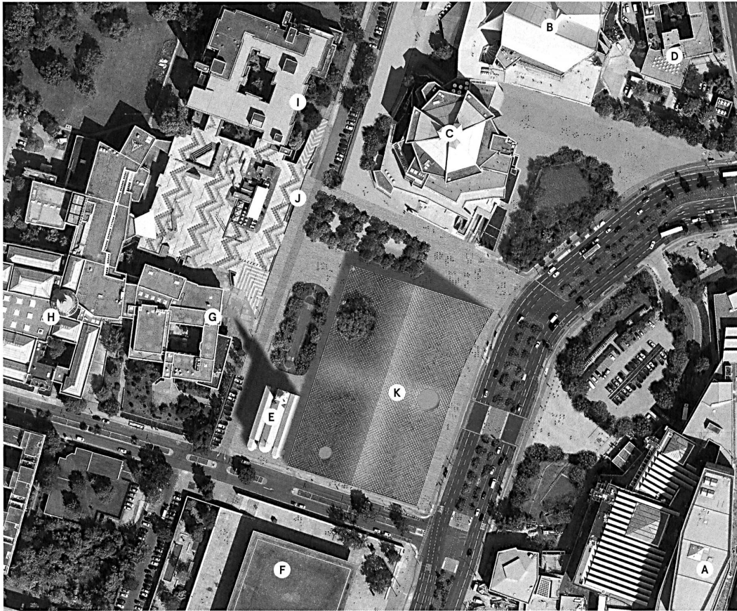
Der erste Preis von Herzog & de Meuron funktioniert wie eine überbaute Strassenkreuzung: Er verbindet Mies' Museum mit Scharoun's Philharmonie, wie auch die Gemäldegalerie mit der Staatsbibliothek jenseits der Strasse.