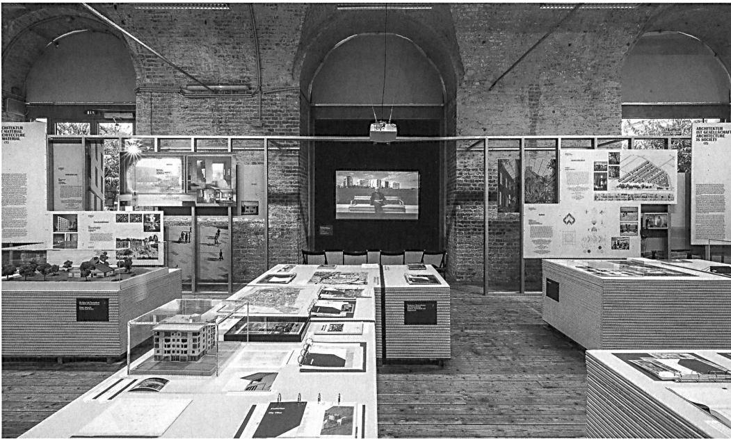
Zentrales Exponat ist der Film zu sechs Dekaden Architekturgeschichte, erzählt von Dietmar Steiner zu seinem Abschied als Direktor des Architekturzentrums Wien.