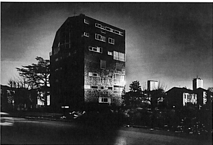
Der Architekt in seinem Haus an der Piazza San Ambrogio in Mailand.

Tatsächlich strapazierte Caccia die gängigen Konventionen der modernen Architektur: Er führte vor, dass Bauen und Wohnen weitaus reicher, bewegter und vielschichtiger sein können als es die funktionalistischen Ideale der Zeit vormachten – was ihm den Ruf eines Nonkonformisten einbrachte. Das aktuell hohe Interesse an seinem Werk liegt wohl gerade in dieser eigenwilligen und ausserordentlichen Haltung. — Elli Mosayebi