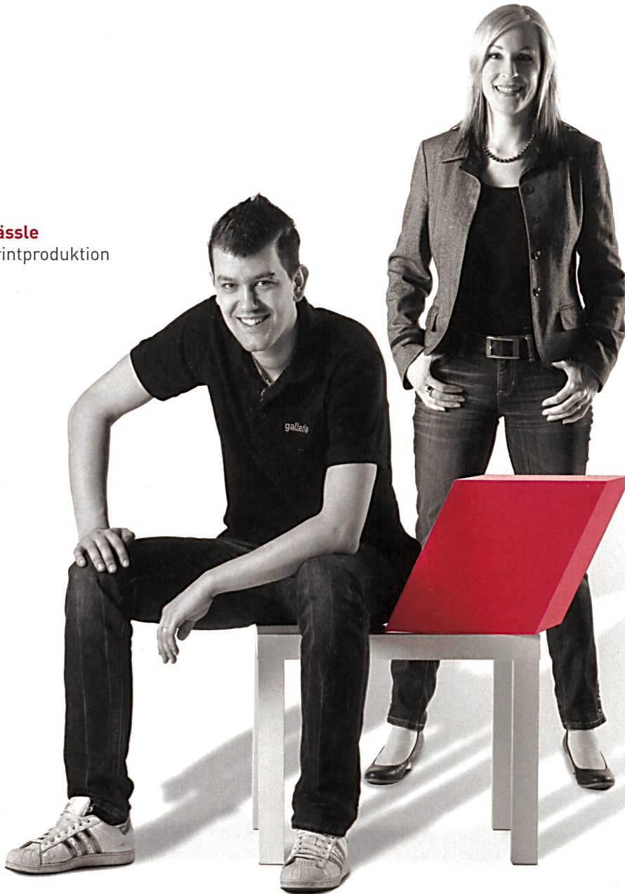
Corinne Sager Digital Solutions

Unsere 220 Mitarbeitenden überzeugen mit Spitzenleistungen. Sie garantieren einen exzellenten Service bei der Realisierung von Fachzeitschriften und Printprodukten sowie in der Umsetzung von Web- und Videoprojekten.