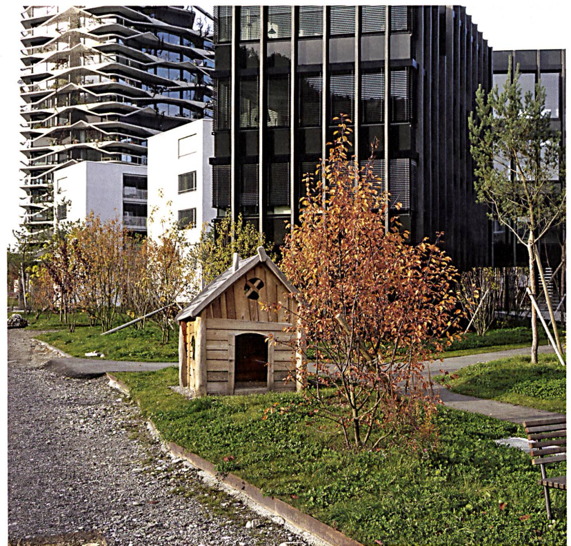
Ein buntes Nebeneinander. Von links: Hochhaus von Buchner Bründler, Hofgebäude von LVP, Wohnhaus von Graber Steiger Architekten.