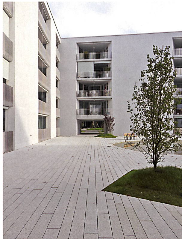
Reduzierter Ausdruck: Der zur Landschaft hin verengte Hofrand von LVPH Architectes.