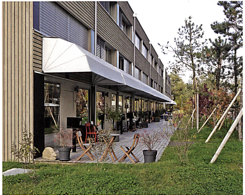
Reihenhäuser mit gemeinsamem Vorplatz von UNDEND Architekten.

Die meisten der beteiligten Planer äussern sich unzufrieden über den Prozess. Die Bewirtschaftung und «Optimierung» durch die Totalunternehmerin Piora hat einigen Projekten (UNDEND, :mlzd) die entwerferischen Flausen gnadenlos ausgetrieben und Poesie durch Mainstream er-