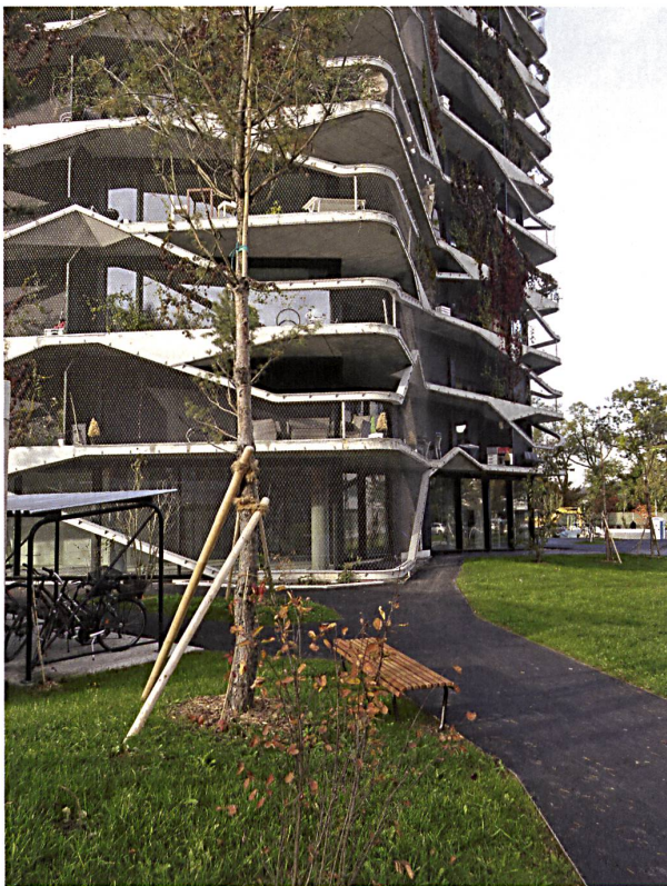
Ungewohnte Dynamik der Form: Das Hochhaus von Buchner Bründler von der Gartenseite.