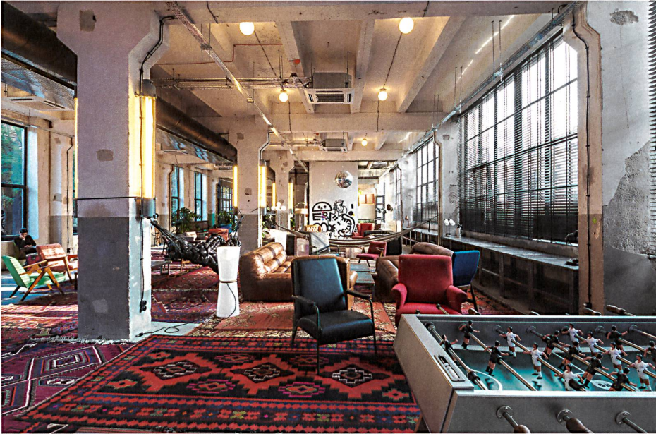
Die Lobby des Fabrika-Hostels im Masstab der alten Industriehalle wird durch Teppich-Inseln gegliedert.

6 www.icomos.org.ge Als Reiseliteratur empfiehlt sich der Architekturführer von Philip Meuser bei DOM Publishers Berlin, der voraussichtlich April 2017 erscheint: ISBN 978-3-86922-325-4. www.dom-publishers.com