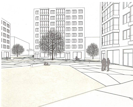
Vier Hochhäuser und ein Platz definieren die neue Mitte des Hohrainli. Hier sind öffentliche Nutzungen erwünscht.