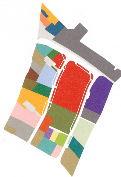
Zersplitterte Eigentumsverhältnisse erschweren eine übergreifende Planung der Siedlungserneuerung. Umso wichtiger sind die grossen Player als Schrittmacher. rot: Turidomus, grau: Stadt Kloten