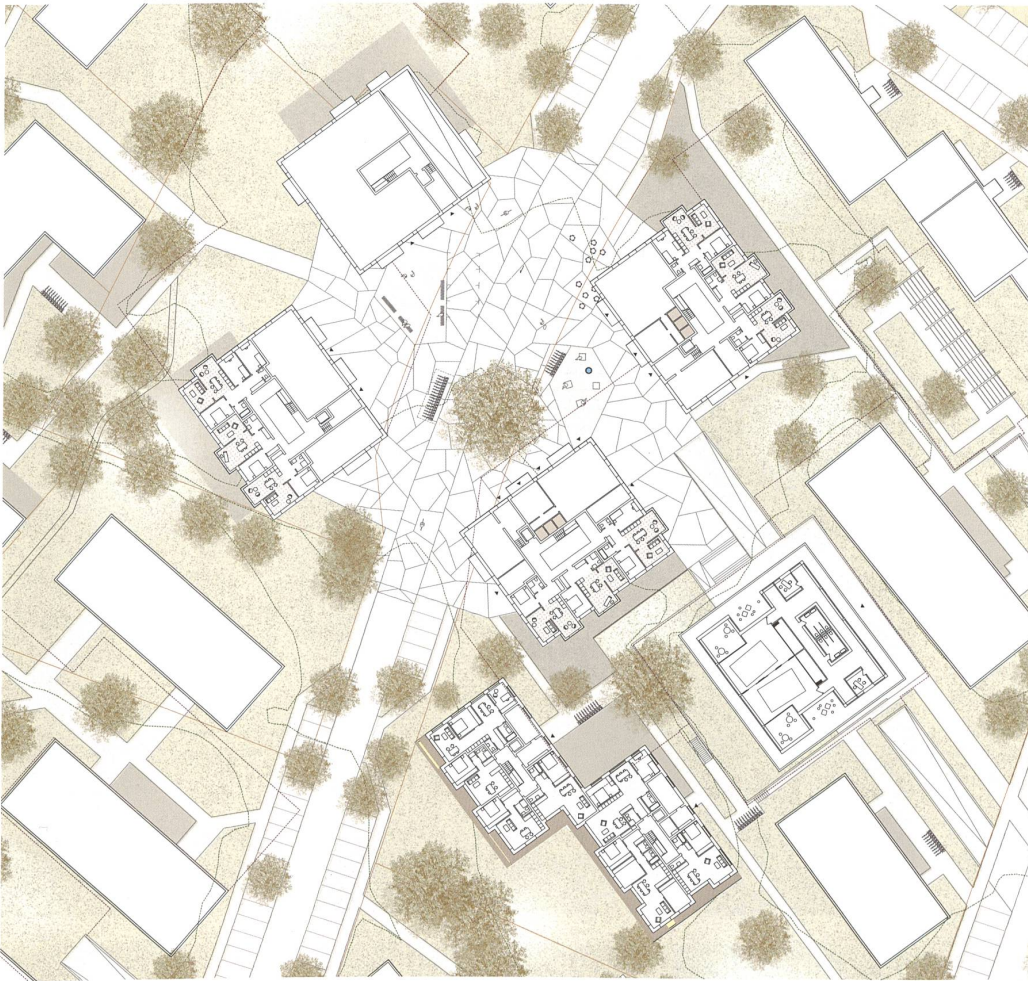
Neue Platzsituation im Zentrum