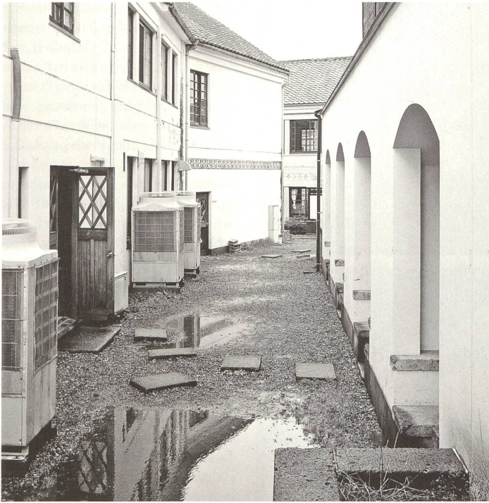
Klimaaggregate und Sitznischen – dass die Ideen einer Muster-Sprache nur bedingt kompatibel sind mit den Realitäten der Hyper-Zivilisation, ist wohl einer der Gründe für die bescheidene Rezeption von Christopher Alexanders Hauptwerk.

liche Antworten gibt das hier zu besprechende Buch Shifting Patterns . Es unterzieht das grösste realisierte Projekt von Alexander und CES (Center for Environmental Structure in Berkeley), die Eishin-Mittelschule im Nordwesten von Tokio, einem Realitätscheck und befragt Akteure rund um deren Planungs- und Baugeschichte. Das fördert viele interessante Anekdoten und Teilspekte hervor und zeigt aus heutiger Sicht – und das ist das grösste Verdienst –, wo und wie Alexanders Pattern Language anschlussfähig ist.