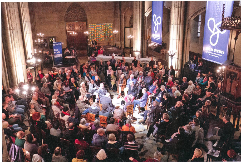
In der Offenen Kirche St. Jakob in Zürich findet Unterschiedliches statt: Konzerte, Debatten, Gottesdienste – und auch Yoga.