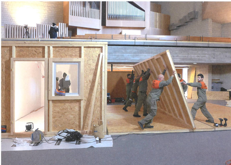
In die geschützte, aber leere brutalistische Kirche Christkönig in Saarlouis setzten die Architekten FlosundK 2018 eine Kita als hölzerne Box.