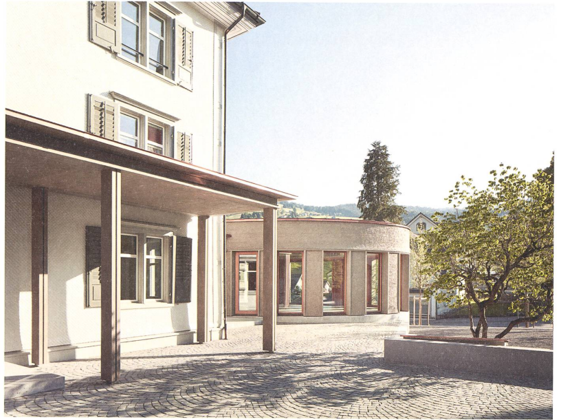
Bergende Form, geschindelte Fassade und verbindender Raum: Das neue Kirchgemeindezentrum