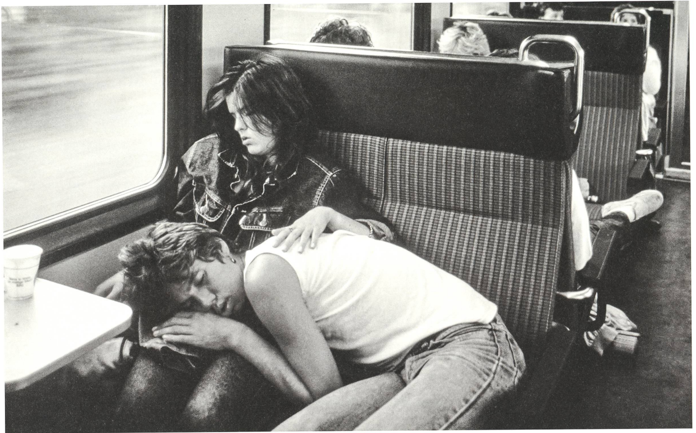
Einheitswagen IV, 2. Klasse, 1982 (Design: Andreas Bürki mit Uli Huber und Ueli Thalmann).