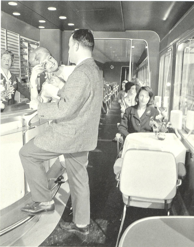
Im Trans Europ Express TEE, 1961 (Design: Walter Henne).

Fahrpläne: Bahndesign hat viele Ebenen, und erst in den letzten Jahrzehnten hat es die SBB im Sinn eines konsequenten Corporate Design vereinheitlicht. Doch schon lange vorher waren die damals grünen Züge mit dem Schweizer Kreuz, die schwarzen Uniformen und roten Taschen Botschafter des Bahnunternehmens – nicht anders als die teilweise legendären Werbeplakate der Bahn («Der Kluge reist im Zuge»).