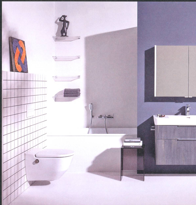
Keramik Laufen AG Wahlenstrasse 46, CH-4242 Laufen T +41 61 765 71 11 www.laufen.ch → Swissbau: Halle 2.2, Stand A18

Bei Cleanet Navia ist die Schallentkoppelung bereits integriert und sorgt dafür, dass weniger Nutzungs- und Funktionsgeräusche auf die Wand und damit in die Nachbarzimmer übertragen werden. Dieses System erfüllt die erhöhten Schallschutz-Anforderungen nach SIA 181 sowie DIN 4109 und wurde durch das Fraunhofer Institut zertifiziert.